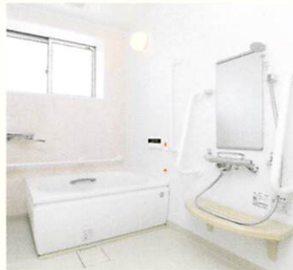
チェリーホーム浴室