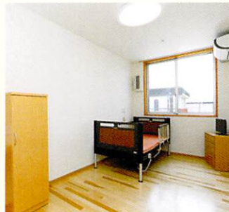
チェリーホーム居室（南向き）