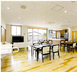
チェリーホーム居間・食堂