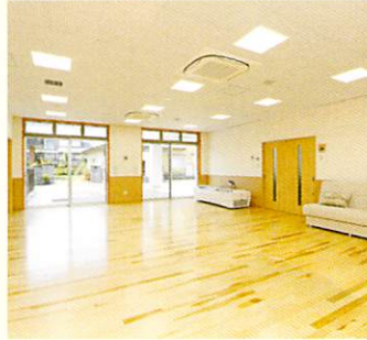
デイサービスセンター機能回復訓練室