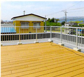
チェリーホームウッドデッキ