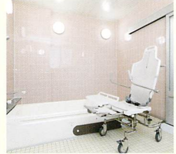
デイサービスセンター個別浴室